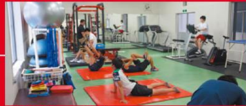
アスレチックトレーニングルーム