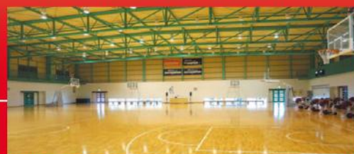
明仙バスケットボ