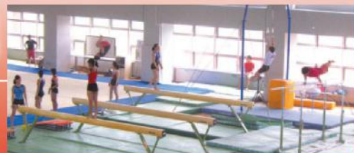
体操競技部(男女) 毎日放課後に仙台大学の施設を利用して、 明成高校と仙台大学が一緒に厳しい練習を重ねています。