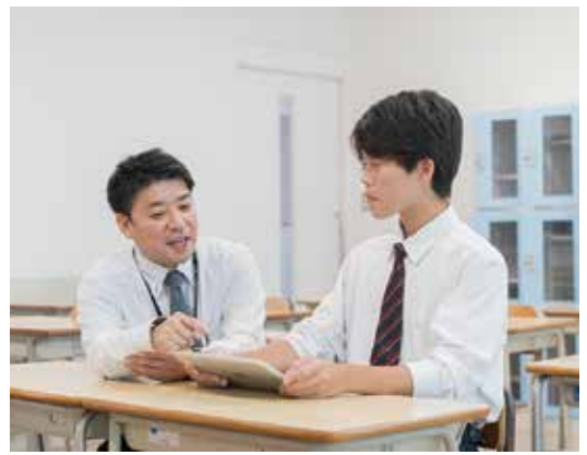
ICTをベースとした普通科個別学習

実社会で通用する 国家資格 大学・専門学校等で取得する資格が高校で取得できます。